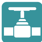
Tanklager & Pipelines