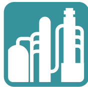
Raffinerie & Chemie