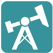
Öl & Gas