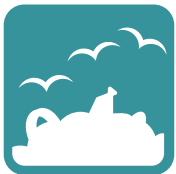
Deponien & Klärwerke