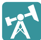
Öl & Gas