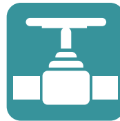
Tanklager & Pipelines