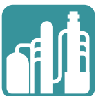
Raffinerie & Chemie